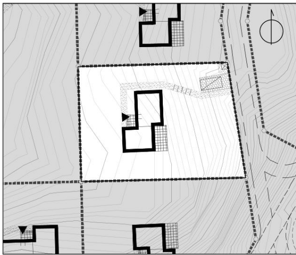
Zagospodarowanie terenu 1:500