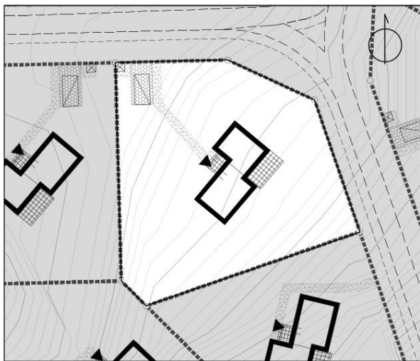
Zagospodarowanie terenu 1:500