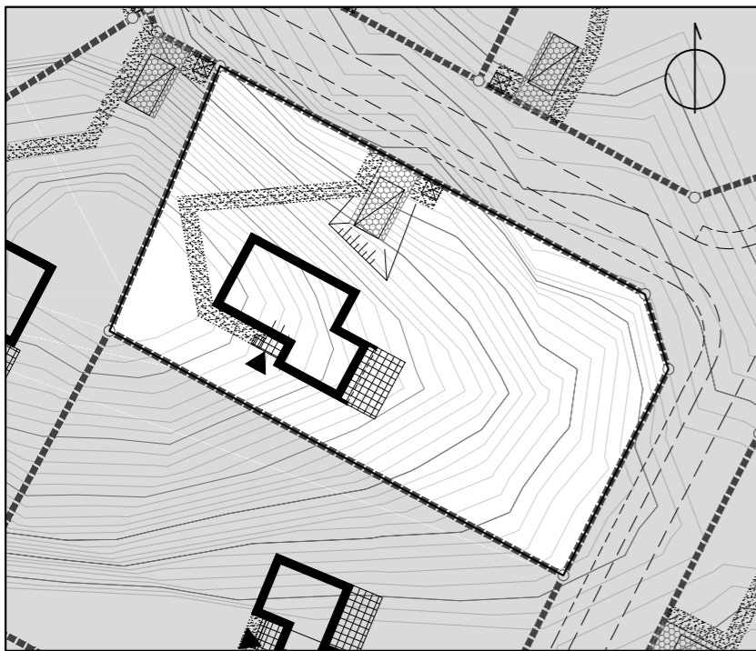
Zagospodarowanie terenu 1:500