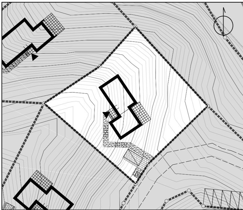
Zagospodarowanie terenu 1:500